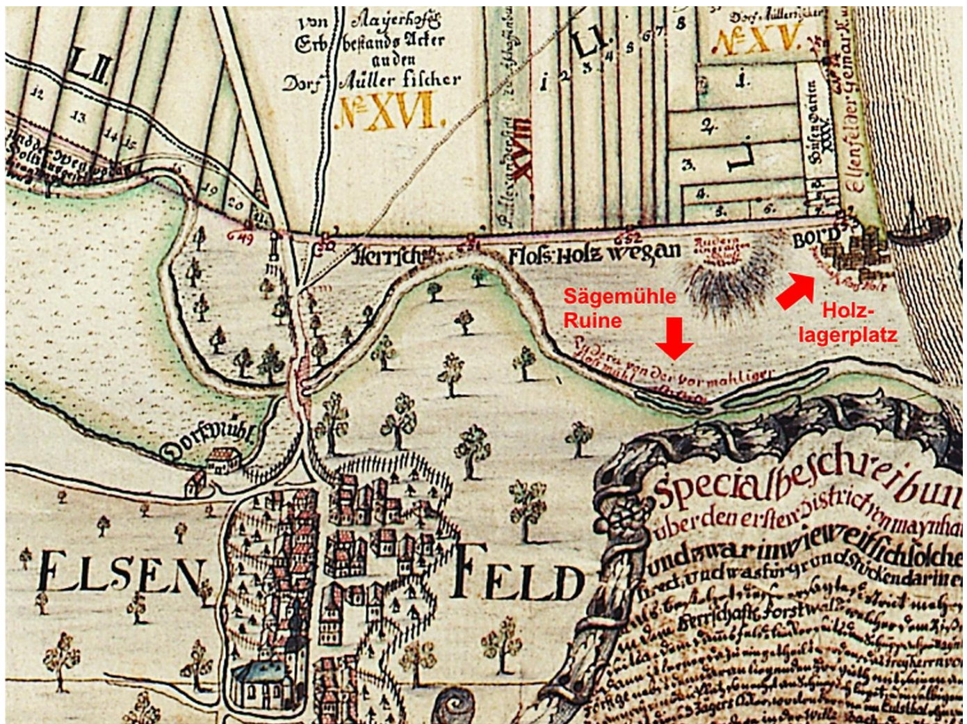
Vermessungskarte des Geometers Weygand aus dem Jahr 1776 mit der neu erbauten Dorfkirche, der Dorfmühle (später Knechtmühle) und den noch sichtbaren Ruinen einer alten Sägemühle.

Die Vergangenheit Elsenfelds war schon immer von der Landwirtschaft und der Holzwirtschaft geprägt, denn das Elsavatal bot einen hervorragenden Zugang zum Spessart. Um das Holz aus dem inneren Spessart an den Main zu bringen, wurde die Elsava schon sehr früh floßbereit gemacht. Bis zum Jahr 1490 war sie floßfähig von der Mündung bis Himmelthal, im Jahr 1550 bis Heimbuchenthal. Später wurden Pferdegespanne verwendet. Das meiste Holz wurde über Elsenfeld zum Main, oder zu den Verladebahnhöfen gebracht. Deshalb siedelten sich in Elsenfeld relativ früh Sägemühlen (mit Wasserkraft betrieben) an. Die erste urkundliche Erwähnung in Elsenfeld ist die Vermessungskarte des Geometers Weygand aus dem Jahr 1776, wo die Ruine einer Sägemühle in der Nähe der Elsavamündung eingezeichnet ist.